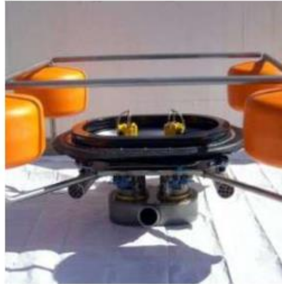
Desnatador de Represas