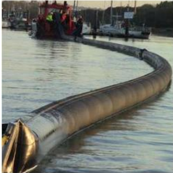
Barra Inflada por aire