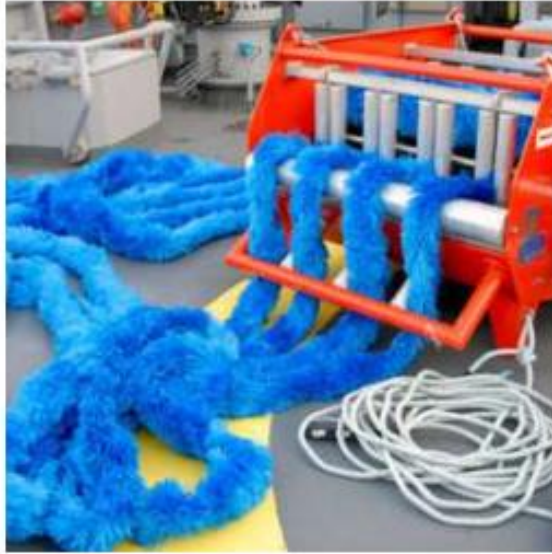
Desnatador de Cuerdas Absorbentes