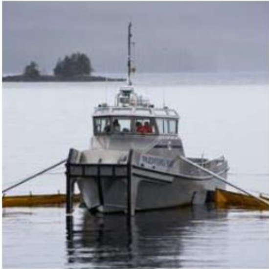
Embarcaciones para Respuesta de Derrames