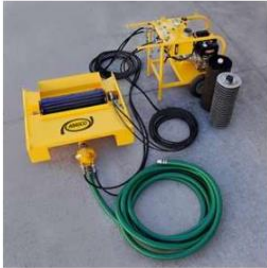
Bombas de Transferencia